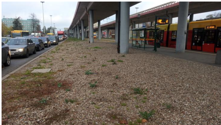
Fot. Ela Urbaniak