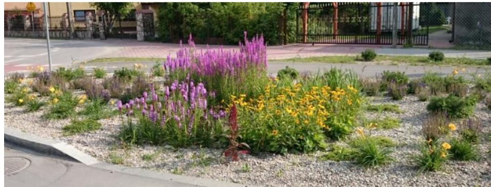
Rondo infiltrujące w Markach