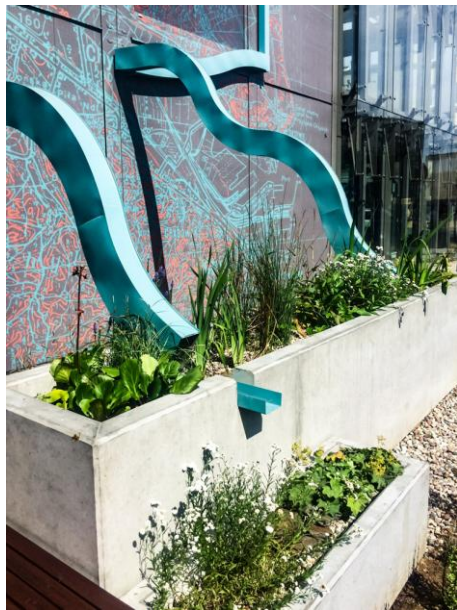
Ogród przy Infoboxie