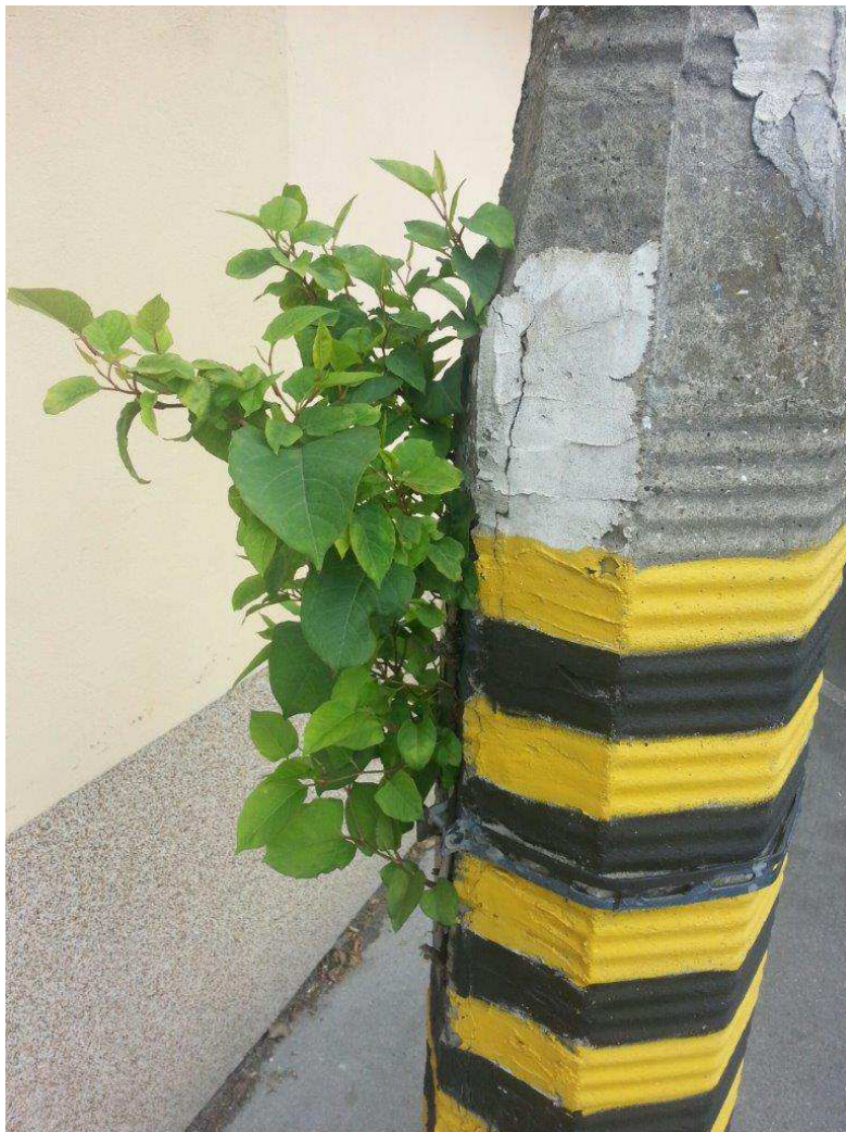
Fot. Rdestowiec (W. Solarz)