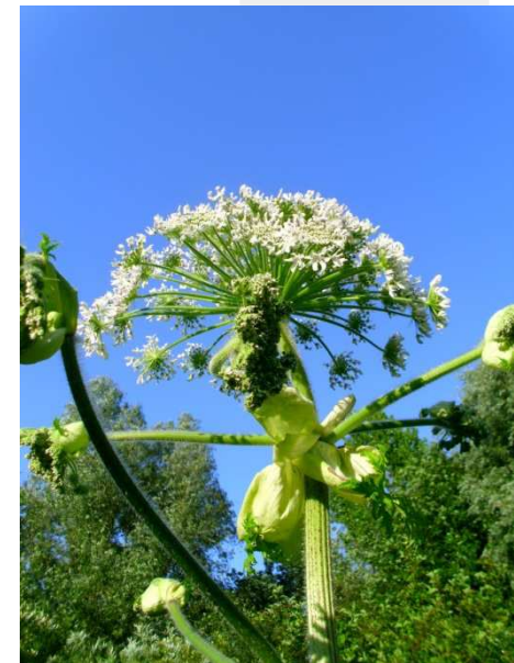
Fot. Barbisz olbrzymi (Wikimedia Commons, Natubico)