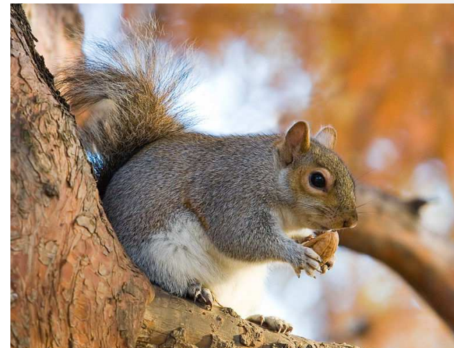
Fot. Wiewiórka szara (David Iliff, Wikimedia Commons)