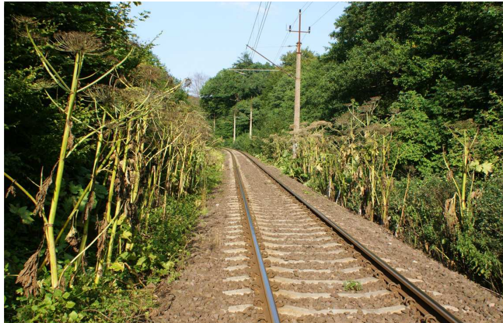
Fot. Barszcz Sosnowskiego, Kołobrzeg-Podczele, 2010 Znak „Stop” w Chinach