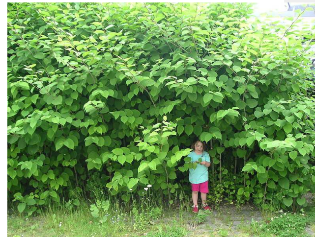
Fot. Rdestowiec japoński (Gav~commonswiki, Wikimedia Commons)