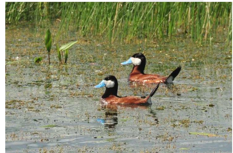
Fot. Sterniczki jamajskie (Tom Koerner, Wikimedia Commons)