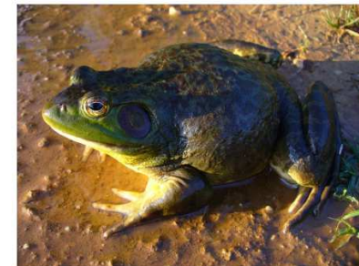
Lithobates (Rana) lessonae (Riccardo Scalera)

Invasive alien species – framework for the identification of Invasive alien species of EU concern ENV.B.2/ETU/2013/0026