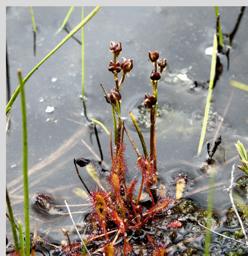
Bagnica torfowa

Brzoza karłowata: gatunek objęty ochroną ścisłą. Występuje głównie z tundrze na półkuli północnej. We florze polskiej jest reliktem glacialnym. W Polsce występuje jedynie na trzech stanowiskach.