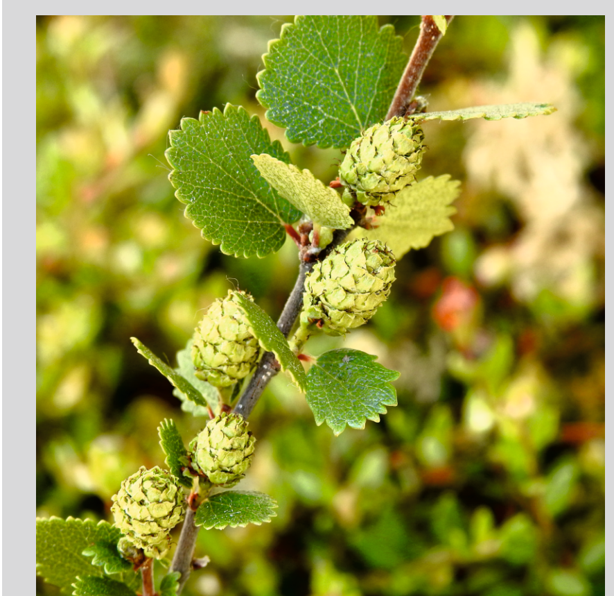
Brzoza karłowata

Występuje tu ok. 180 gatunków roślin nasiennych, m.in. brzoza karłowata Betula nana , kosodrzewina Pinus mugo , rosiczka okrągłolistna Drosera rotundifolia , turzyca skąpokwiatowa Carex pauciflora , bagnica torfowa Scheuchzeria palustris oraz ok. 71 gatunków ptaków, w tym sóweczka Glaucidium passerinum , włośchatka Aegolis funereus , cietrzew Lyrurus tetrix .