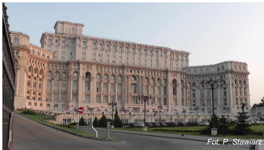
Fot. P. Stawi r