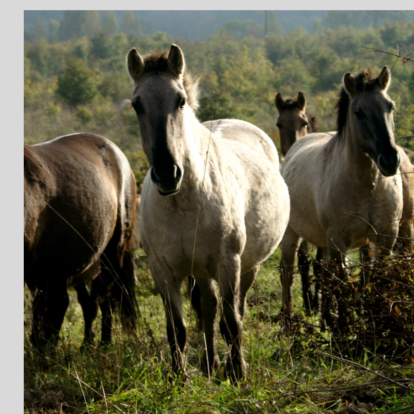
Koniki polskie

Stwierdzone w obszarze zagęszczenie żurawia należy do najwyższych w kraju.