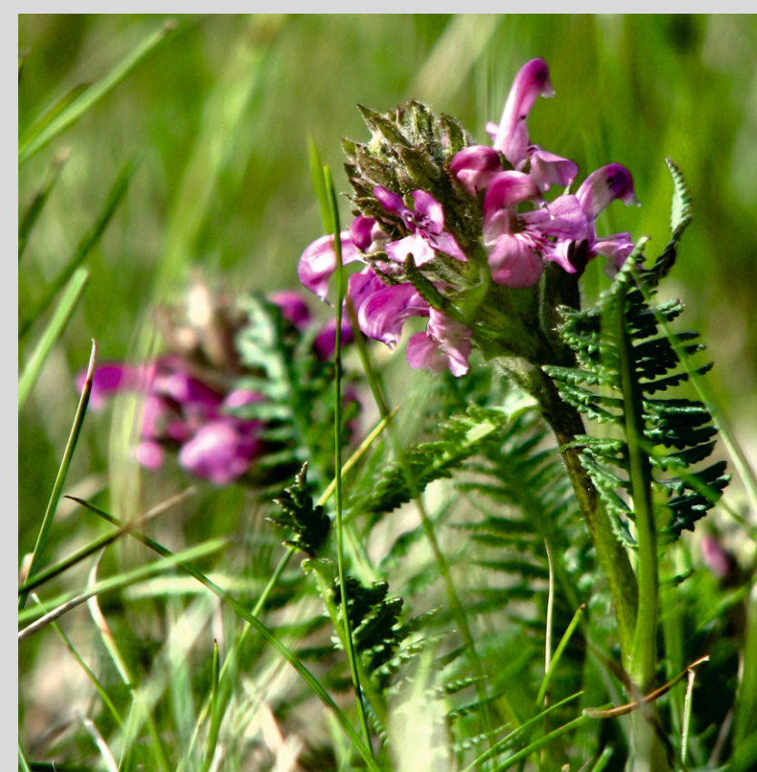
Gnidosz sudecki

Na torfowiskach rosną zarośla kosodrzewiny i relikty połudowcowe: gnidosz sudecki, malina moroszka, turzycza patagońska, torfowiec Lindberga.