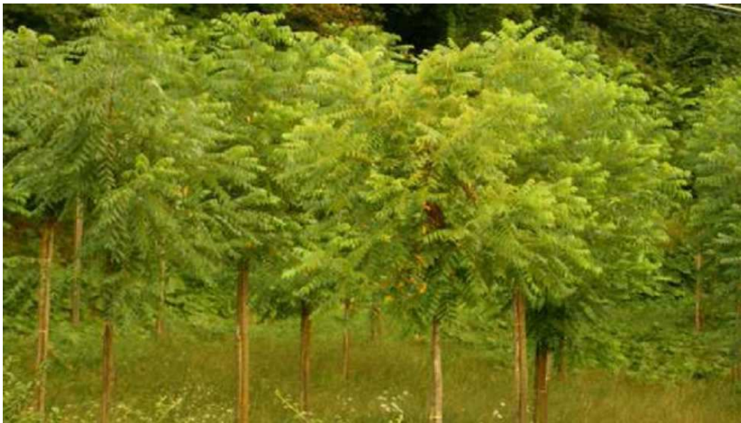
Chwast Ailanthus altissima występujący "wszędzie" i nadal proponowany jako uprawy energetyczne